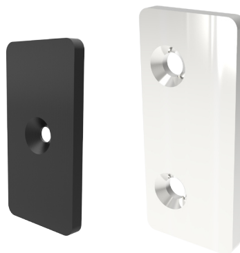
PIASTRA IN PLASTICA P1830