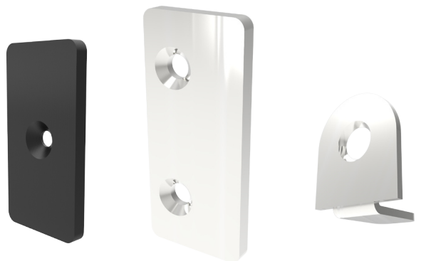
PIASTRA IN PLASTICA P1830